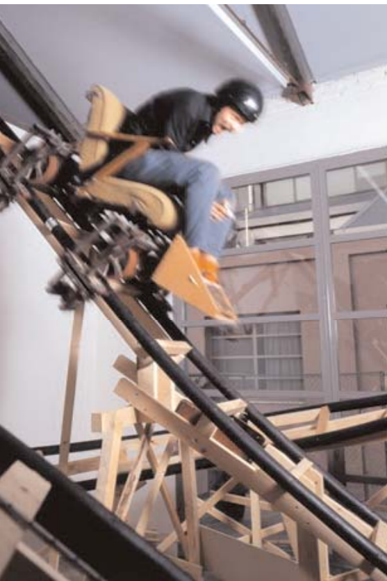
In der Mailänder Galerie Massimo De Carlo baute Gelatin 2004 eine Achterbahn, die absolut funktionstüchtig war. Die Künstler verstanden die Arbeit „Otto Volante“ als „Geschenk an Otto, Großmutterns geliebte Kuh“