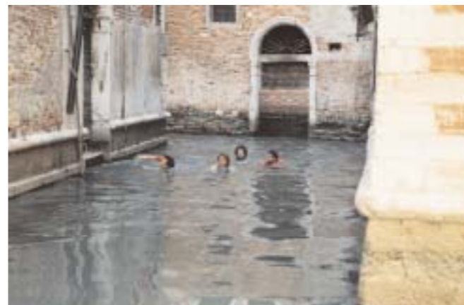
Venedig ist die Stadt des Wassers, und doch käme normalerweise niemand auf die Idee, im Kanal zu baden. Zur Biennale 2001 taten Gelatine genau das: Die Aktion „Nellanutella“ bestand aus slapstickhaften Kopfsprüngen in die trübe Suppe von Venedig

Als Maschine ihrer eigenen Träume sind die vier Wiener, die sich in einem Jugendferienlager kennenlernten, unschlagbar: „Wenn wir zusammen sind, funktionieren wir wie ein einziger Organismus“