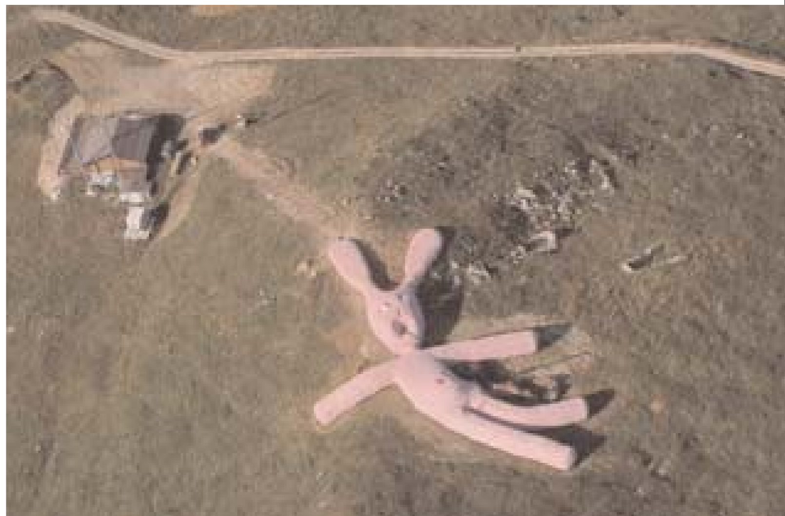
65 Meter lang ist der große Wollhase, den Gelatin 2005 im Piemont auf eine Bergkuppe legten – damit er dort langsam „verwese“

Schließlich rettet man sich über aufgehäufte alte Matratzen ins halbwegs Trockene, auf ein zerschlissenes Flohmarktsofa – hebt den Blick und staunt: Fröhliche nackte Menschen klettern über Gerümpelberge zu gemütlicheren Chill-out-Lagern und kriechen in grüne, aus dem Plastik von Müllcontainern zusammen geschmolzene insektenhafte Gelatin-Sauna-Kapseln, wie man sie aus ihrer Ausstellung „Möbelsalon Käsekrainer“ (2004) in der Wiener Galerie Meyer Kainer bereits kennt. Und zwischen all dem, wie eine Art ungezogener Koloss von Rhodos, beugt sich