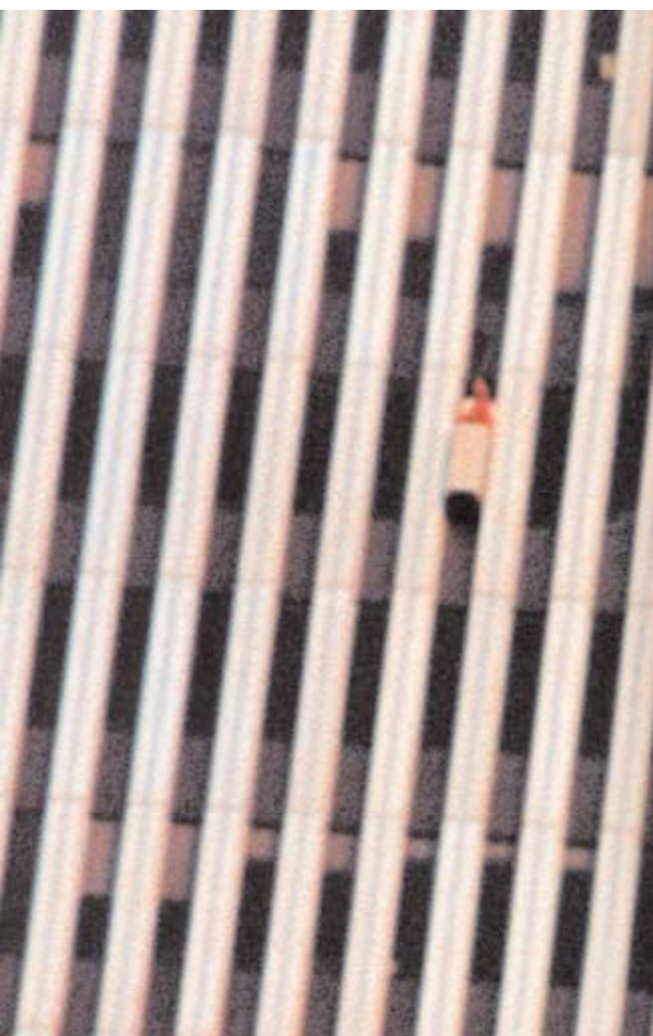
Heute hält man bei diesen Bildern den Atem an: Gelatin lösten 2000 im 91. Stock des New Yorker World Trade Center ein Fenster heraus und brachten draußen für 20 Minuten einen Balkon an