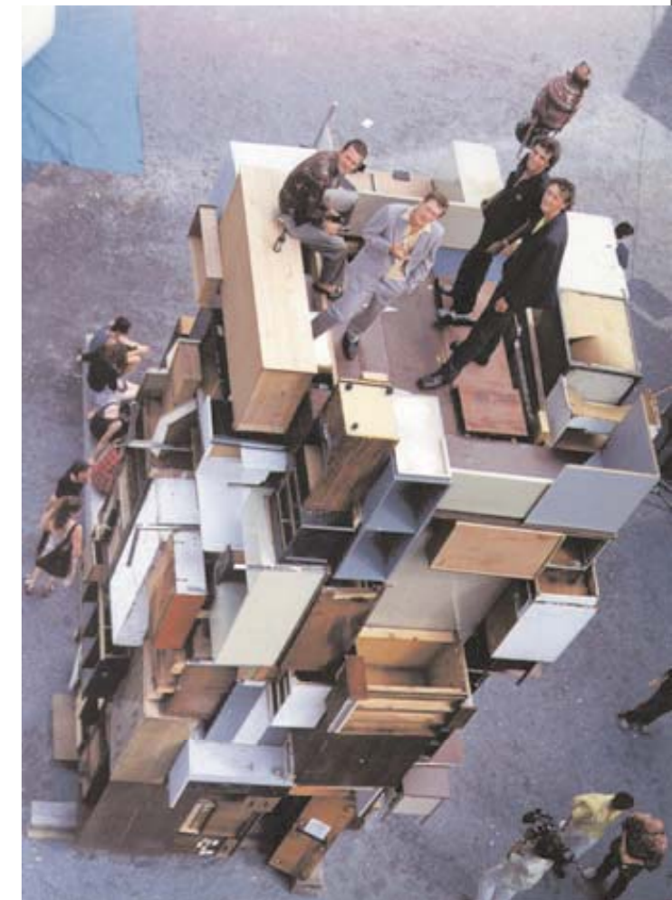
Oben: Gelatine in New York. Im P.S.1 baute die Gruppe 1998 eine Installation aus alten Möbeln, drinnen gab es verschiedene Räume, so etwa einen Kälteraum, einen Nackt- und einen Ankleideraum. Linke Seite: Auf der „Art Basel Miami“ 2004 war Gelatine mit der Raumarbeit „Operation Rose“ vertreten

Von der Popindustrie lernte die Gruppe, wie man schnell Aufmerksamkeit erlangt: „Wir machen visuelles Showbusiness“